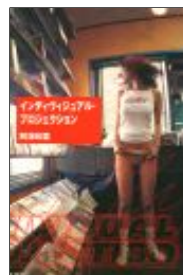
阿部和重著 『インディビジュアル・プロジェクト』（新潮社刊）撮影・装幀

フジテレビ『オナジソラノシタ』写真撮影 OA (2004) 携帯サイト GIRLS LIKE YOU 撮影 ディレクション (2004) ガンダム展 (2005 天保山サントリーミュージアム) 参加 ブランフ エアライン エキスポ ポスター他アートディレクション デザイン (2004-2005) 野外ライブイベント『ナチュラル・ハイ96』 ポスター・フライヤーデザイン シティボーイズ公演『愚者の代弁者 うっかり東へ』 フライヤーデザイン 湯沢パークスキー場『BOTOWN』キッズパーク『SLIPPY』 ディレクション&デザイン 湯沢パークスキー場『BOTOWN』スノーボードデザイン PIZZICATO FIVE VS BEAMS Tシャツデザイン (3種) CD-ROM『FUTURE GIRL』シリーズ アートディレクション CASIO『G-SHOCK』海外向けパンフレット イラストレーション FD『Macintosh (FLOPPY+ART)』(DIGITALOGUE) FD『WORLD OF MARS ART LAB. 1994』 ロゴタイプ集 『THE NEW CREATORS EXPRESSION FILE Vol.1 MARKS AND SPARKS』 Windows用ゲーム『MARIA』（ボニーキャニオン） パッケージデザイン Play Station用ゲーム『JET MOTO』 (ソニー・コンピュータ・エンタテインメント) パッケージデザイン 『ポストベット』お部屋デザイン 『ポストベット』モモリカ パッケージデザイン 加藤紀子 1999年カレンダーデザイン V6 2000年カレンダーデザイン 『beat mania』ファミコン通信オリジナルコントローラー デザイン パルコ『レゴ展』作品出品 福岡イムズ『10×10展』作品出品 アニメ『彼氏彼女の事情』 (KING RECORDS+ガイナックス)ビデオ・LD パッケージデザイン ZARDベストアルバム用ノベルティデザイン マルちゃん『カップヌードル』プレゼント用、銀スカジャンデザイン ファッションビル『STONES』（大阪）キャンペーンディレクション