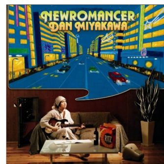
『NEWROMANCER』 (カッティング・エッジ)