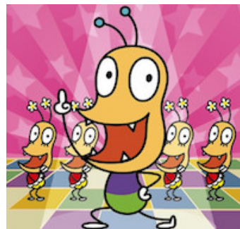
NHKみんなのうた『おしりかじり虫』