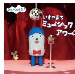
NHK Eテレ 『みいつけた!』