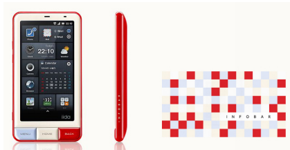
au iida INFOBAR R A01