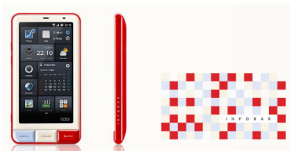
au iida INFOBAR R A01